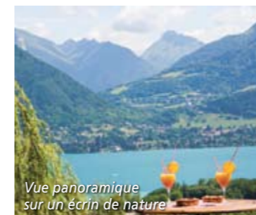
Vue panoramique sur un écrin de nature

Séjours à thème et promos : www.village-vacances.com