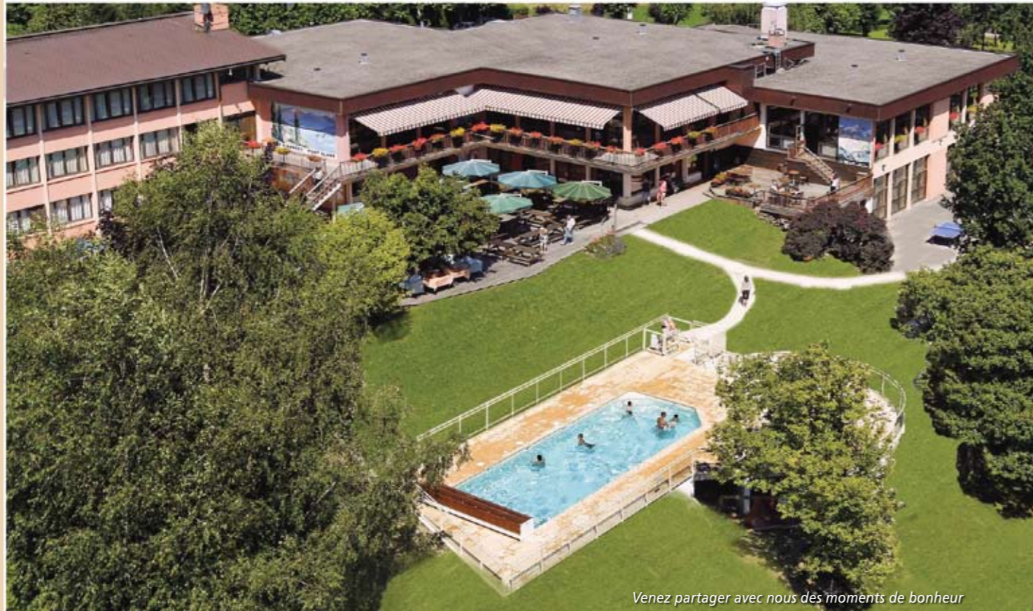
Venez partager avec nous des moments de bonheur