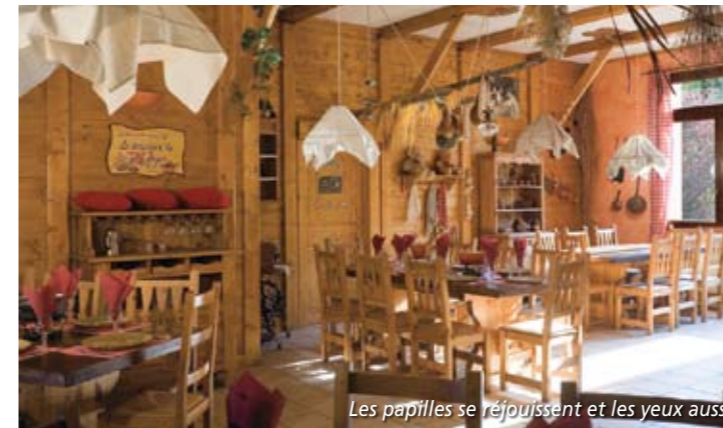
Les papilles se réjouissent et les yeux aussi