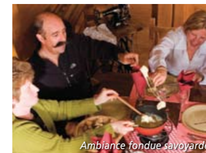
Ambiance fondue savoyarde