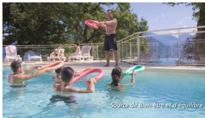
Source de Bien-être et d'équilibre

Dominant le lac et son écrin de montagnes, Les Balcons du lac d'Annecy vous invitent à des vacances 100% oxygène en Haute-Savoie. Randonnées, canoë, VTT, canyoning, rafting et même voile : le menu des activités est varié ! Au fil des canaux d'Annecy, bordés d'élégantes demeures du XVII ème siècle, on flirte avec l'histoire. Et là-haut, dans le parc naturel des Bauges, on piste les marmottes entre chalets de bois, verts alpages et sommets étincelants...