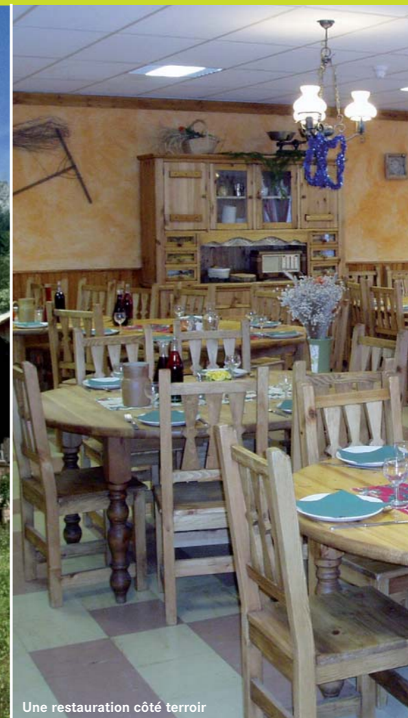
Une restauration côté terroir