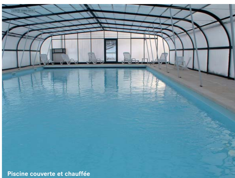
Piscine couverte et chauffée