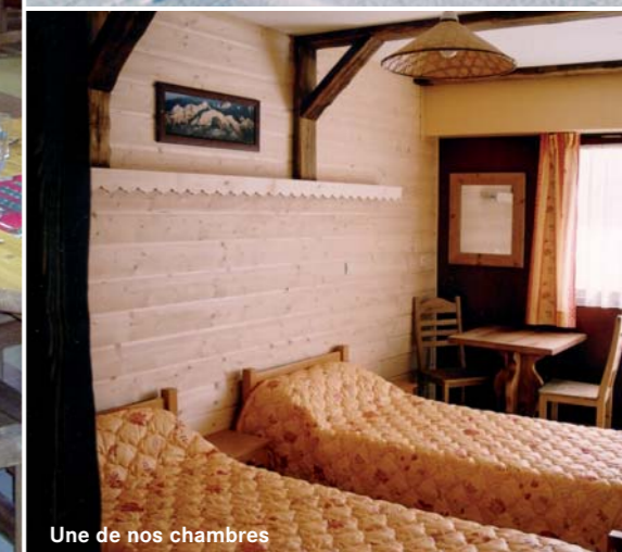
Une de nos chambres