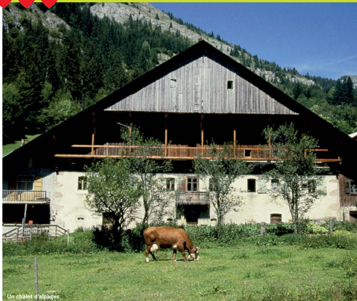
Un chalet d'alpages